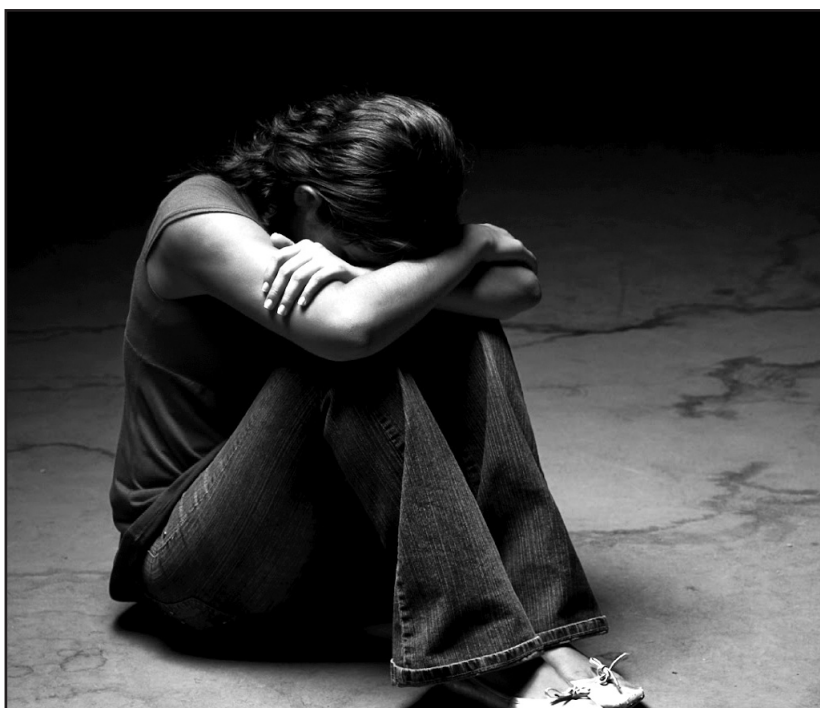
Por lo menos un integrante de cada cuatro hogares mexicanos sufre algún trastorno mental.