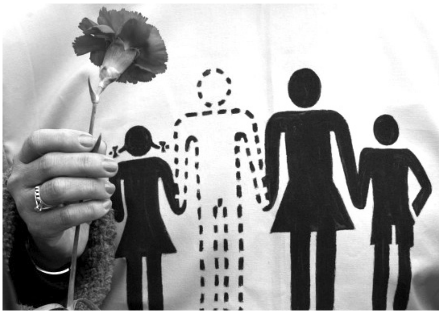
Cuando se presenta una desaparición forzada, un secuestro la ausencia cala hondo.

Una vez que alguien ha nacido y se le registra, su vida comienza a tener una existencia simbólica, además de la familiar que con los seres queridos ya tenía. Esa nueva presencia corta el tiempo y el espacio para el nuevo ser. Al poco tiempo se van tejiendo vínculos y relaciones en el entramado social más amplio (escuela, grupos de amigos, trabajo, el Estado y sus políticas públicas, etc.) cada contacto se despliega en un lazo humano donde puede haber lo mismo amor, como odio,