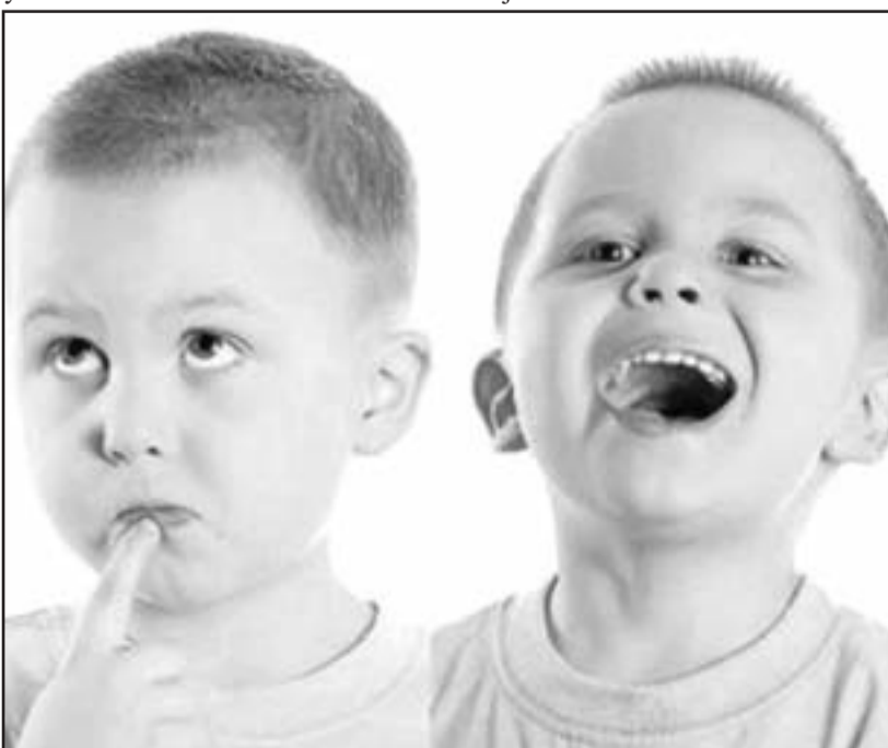
Los menores con este disturbio mental experimentan cambios inusuales en su estado de ánimo.

• La anomalía en la estructura y función del cerebro