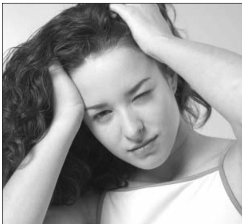
Se trata de una terapia no invasiva y libre de fármacos.