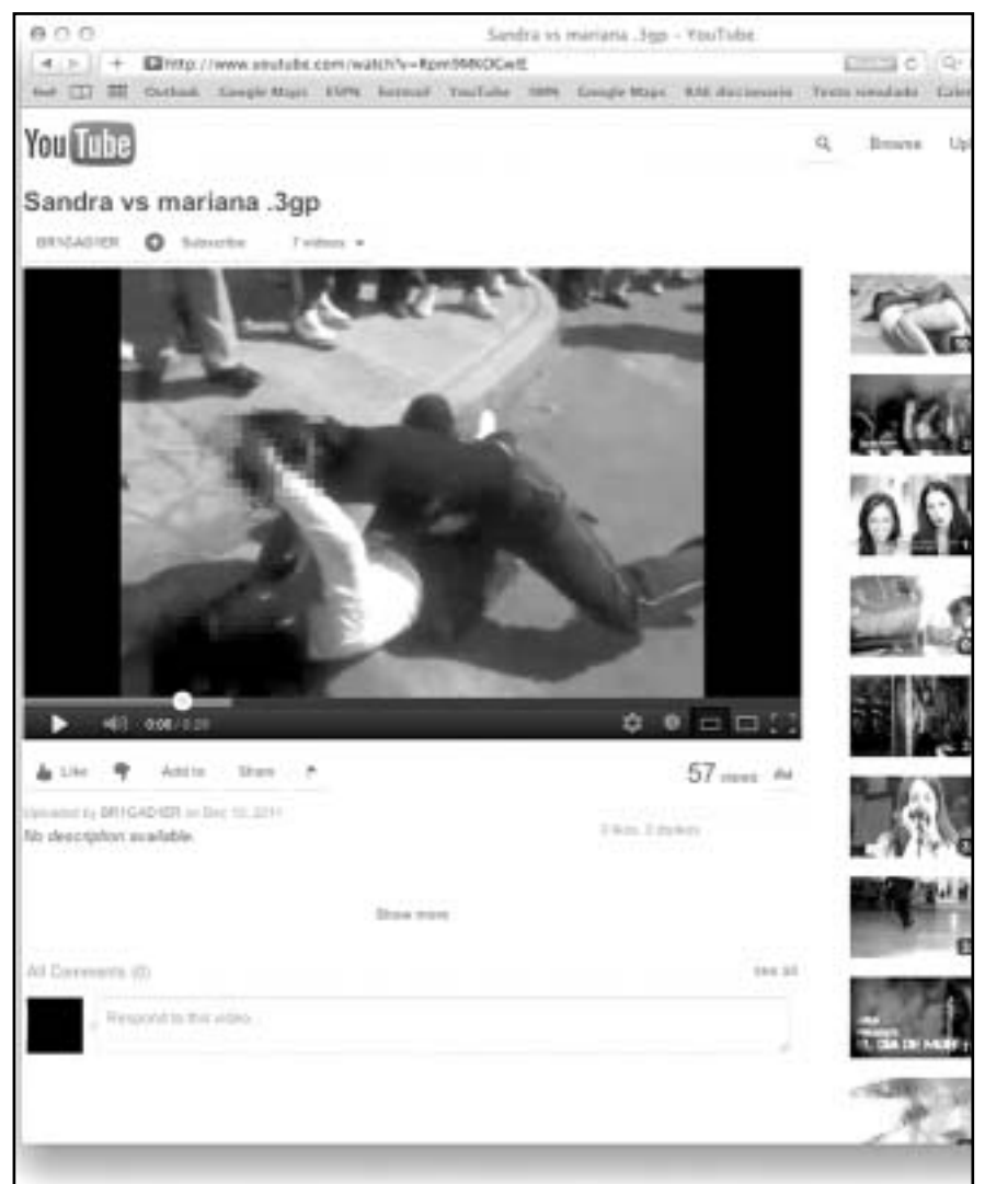
Las nuevas generaciones abusan del uso del Internet en el sentido de que se les hace fácil dar a conocer peleas o sexo explícito.

Explica que maestros y directores de escuelas le han hablado sobre sus constantes intentos de hacer entender a los estudiantes que lo que suban a la