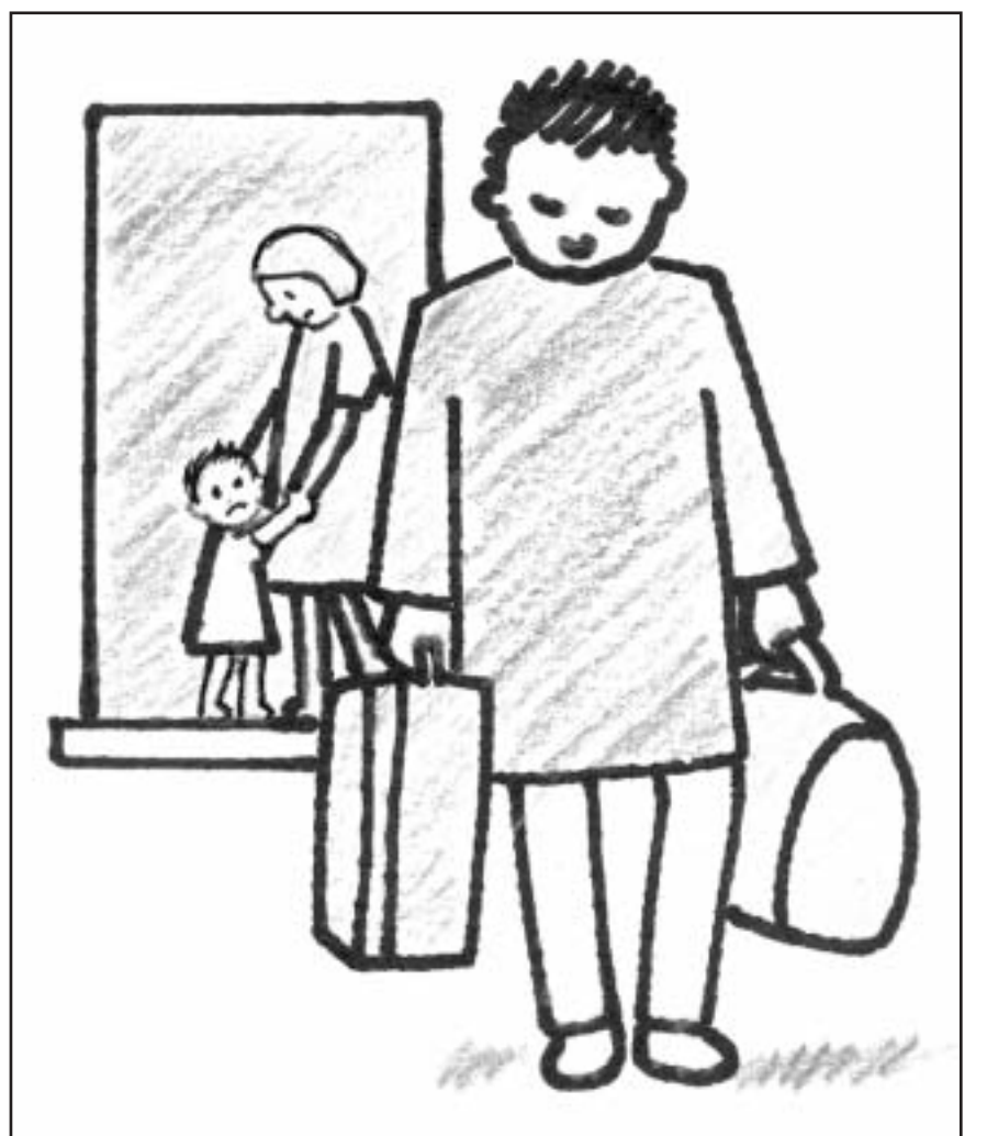
Regresar con una persona por el hecho de pensar que se es lo mejor para el otro habla de una baja autoestima.

Por otra parte, querer regresar con una persona a la que se dejó también puede indicar un grado de culpa no