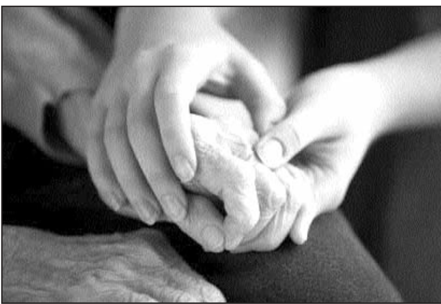
El Parkinson es un padecimiento crónico.