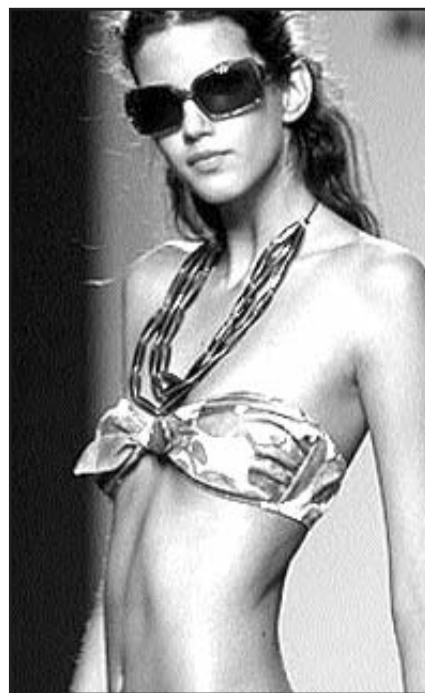
Las modelos actuales no ayudan.

medad son: Piel delgada y seca, dolor abdominal, periodos prolongados de ayuno o de subalimentación, pérdida de grasa corporal, sensación de plenitud, intolerancia al frío, estreñimiento, pérdida de la menstruación, temor a aumentar de peso, utilizar ropa demasiado holgada, vigorexia -trastorno o desorden emocional que afecta más varones, provoca que la persona se vea a sí misma de manera distorsionada- y abuso de laxantes