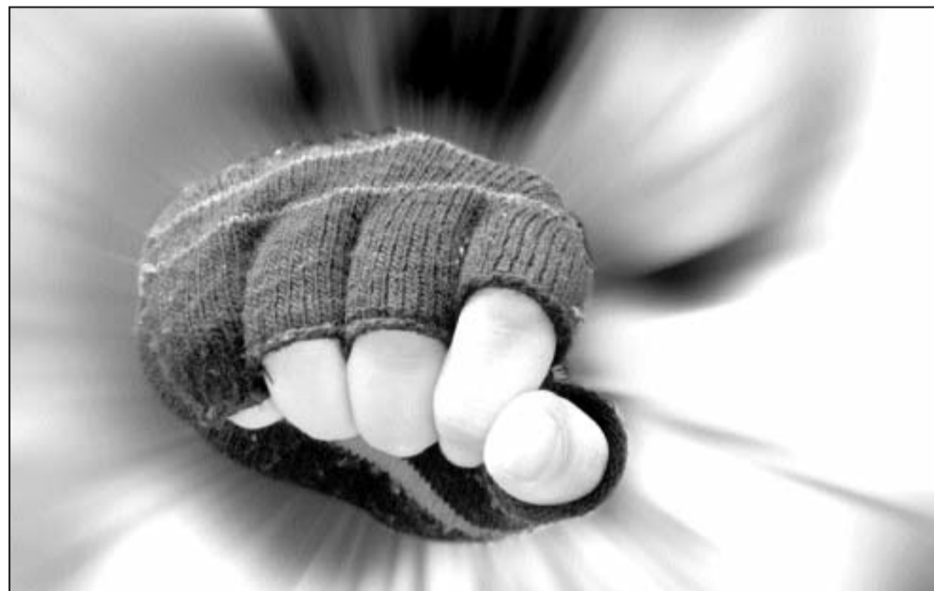
Los individuos que generan violencia se consideran a sí mismos víctimas en mayor grado que la población común

un periodo de alrededor de ocho minutos de duración. Si el enojo dura más es porque la persona genera, mediante el pensamiento y/o la imaginación, mecanismos que lo alimentan, como el de revivir la situación que lo disparó o el de repetirse a sí misma lo injusto o inconveniente que es aquella.