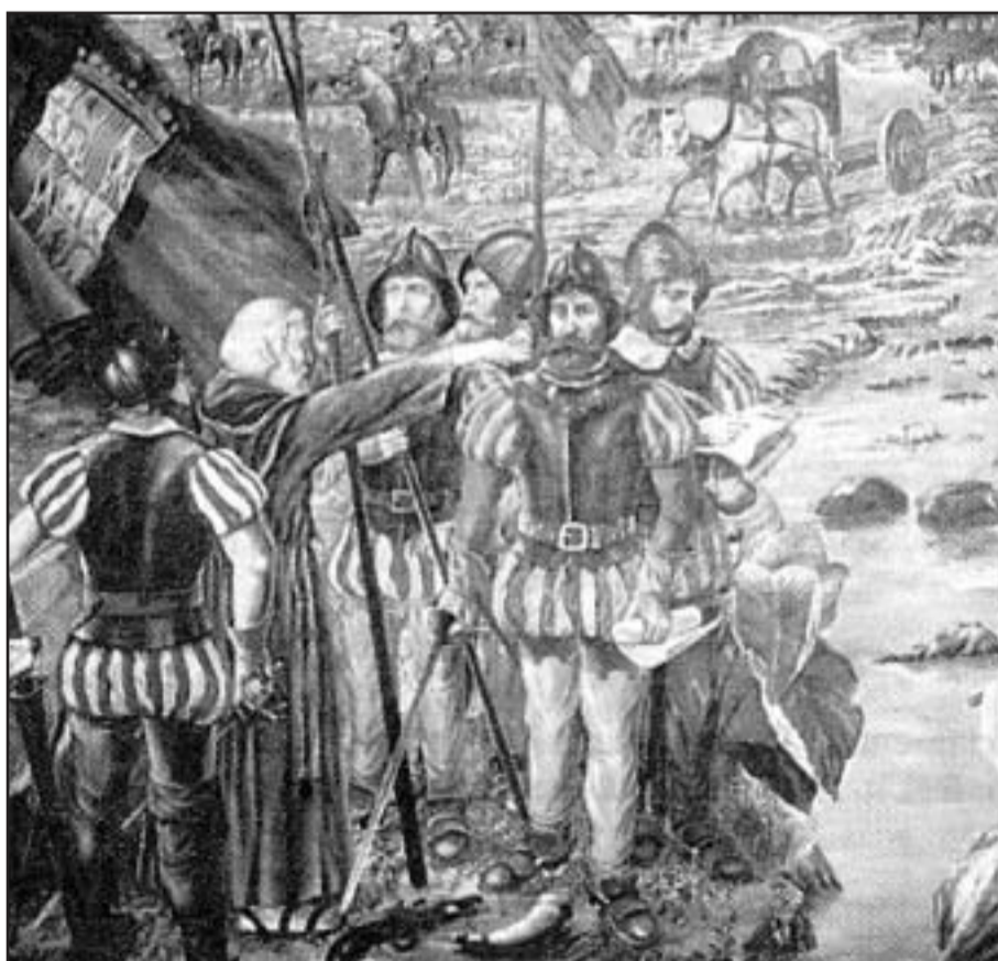
Aquel territorio dista mucho de ser lo que hoy en día.

La gente se dedicaba fundamentalmente a la agricultura. Había problemas que ahora no lo notamos de falta de agua. Había que rentar el agua, se rentaban las acequias que abrían de acuerdo con lo