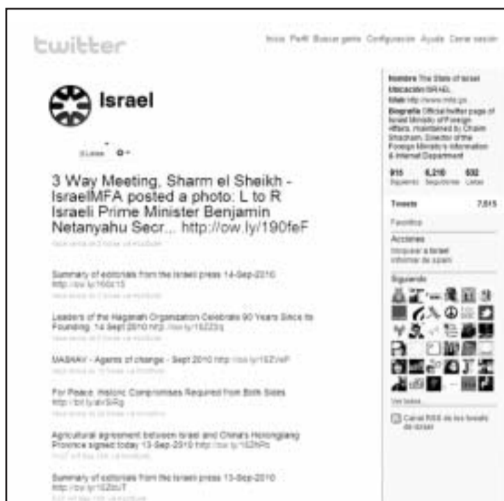
La cuenta fue creada antes del 'boom' en la red.