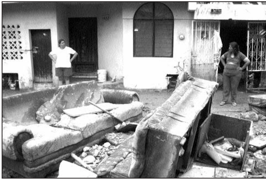
Llevarán ayuda a quienes más lo necesitan.