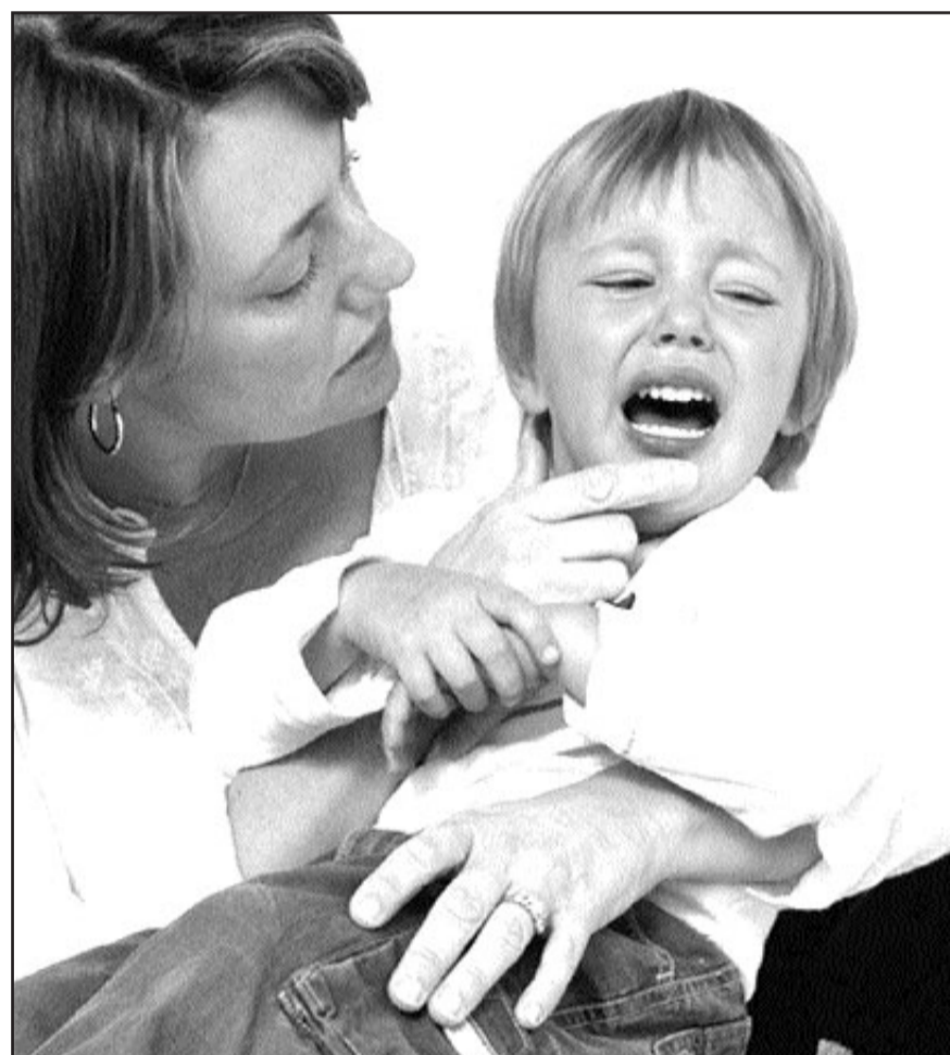
Los padres tienen tendencia a proteger a sus hijos.

Los padres tienen tendencia a proteger a sus hijos, los ven pequeños indefensos, los abrazan cuando lloran, los atienden cuando están triste y los cuidan de peligros, se preocupan ante una fiebre o enfermedad es lo normal, pero protegerlos y preocuparse en exceso, pendientes a cada momento de sus necesidades, si tienen hambre, complacen todos sus caprichos, no los dejan jugar por miedo a que se golpeen, no les permiten estar descalzos o que tengan contacto con el piso para que no se ensucien o se infecten, les dan la comida para asegurarse de su alimentación, los bañan, los visten porque pobrecito no saben hacerlo, o porque necesitan salir rápido al trabajo, y cuando llegan las obligaciones escolares, son los primeros en sentarse a hacerles las tareas, estos son amores que asfixian y traen como consecuencia niños caprichosos, dependientes llenos de límites, no conocen las frustraciones, ni los contratiempos, no aprenden a valorizar, ni a ganarse los premios, crecen sin sentido de responsabilidad, con dificultad para la toma de decisiones y por supuesto no resuelven sus propios problemas, generalmente son niños y adolescentes y hasta adultos manejable por otros, con poca