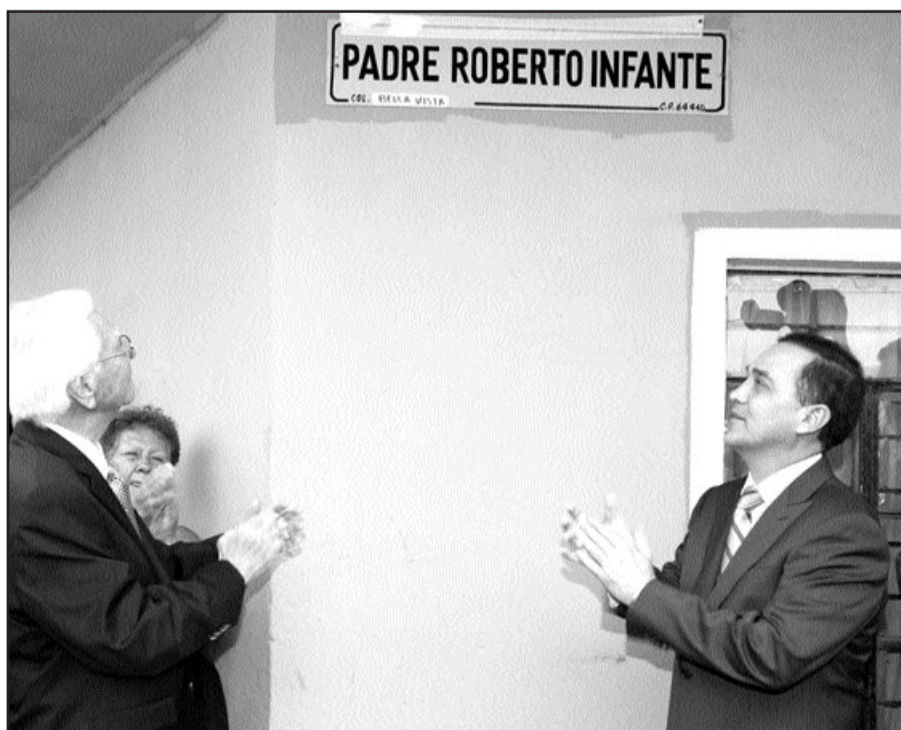
Su obra será recordada por los regiomontanos.

Imponen nombre a la calle donde se ubica “Comedor de los Pobres”