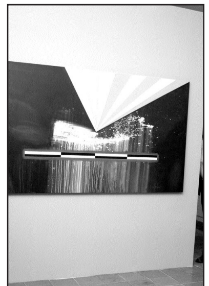
La exposición se inaugura este 26 de mayo.

Aunado a esto que muchas de las piezas se encontraban con coleccionistas particulares radicados en la ciudad, lo cual facilitó la selección de 50 piezas del alrededor de unas 200, dejando fuera obras realizadas en papel y retratos, que aún no han sido exhibidos permaneciendo en su taller.