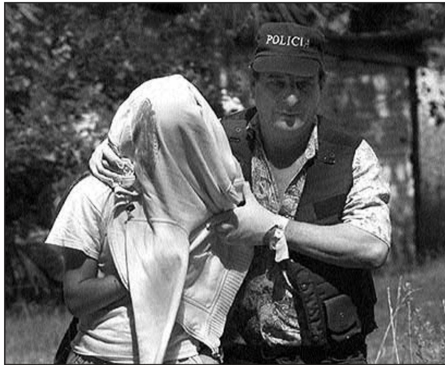
El secuestro, al ser un negocio, puede ser considerado como un efecto más de lo humano reducido a simple valor económico.

A pesar de que el secuestro se circunscribe a un tiempo específico, desde que el sujeto es privado de su libertad, se realiza el contacto con su familia, hasta la solicitud del rescate y -en el mejor de los casos- la "devolución" del familiar. Los efectos se extienden más allá, pues con el secuestro se han minando las condiciones mínimas de existencia que un sujeto y familia requieren para poder vivir, trabajar, estudiar, divertirse, etc.: la seguridad e integridad. En pocas palabras ¡Se ha jodido su espacio vital!