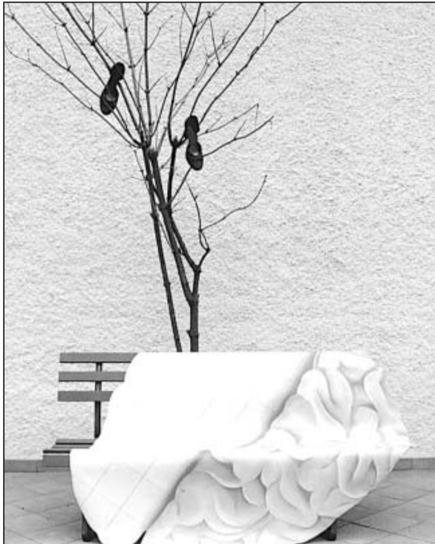
El psicoanálisis propone una nueva forma de conceptualizar al ser humano. elementos y procesos que se infieren en la locura.

A diferencia de la psiquiatría, para el psicoanálisis “la enfermedad mental” no es meramente algo extraño al sujeto, como una afectación orgánica de un substrato anatómico o fisiológico; un trastorno o proceso psicopatológico que hay que quitar, dar la cura, sino formas subjetivas, es decir, posiciones particulares desde donde cada cual se vincula, percibe, ama-odia, vive y convive con el otro y con su realidad circundante. Donde la normalidad es inexistente. En última instancia, todos estamos constituidos por los mismos