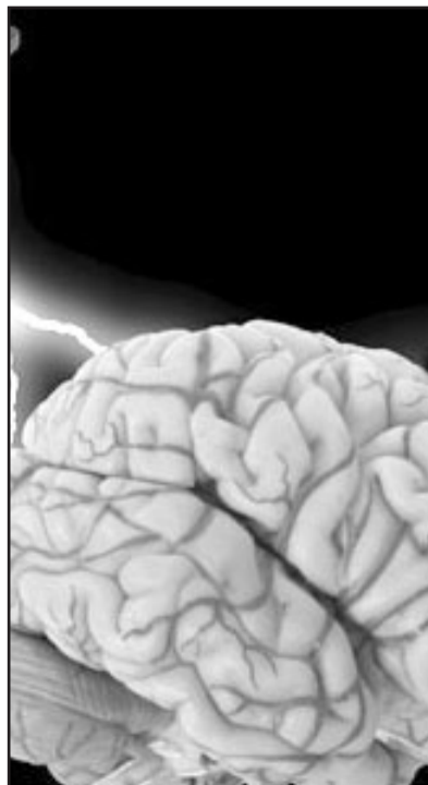
Hay canales de odio.

Asimismo, el trabajo descubre que el odio tampoco comparte un patrón cerebral con otros sentimientos con los que podría tener algo que ver, como la ira, el enfado o el miedo. La amígdala, el cíngulo anterior, el hipocampo, las regiones medio temporales y la corteza orbitofrontal no tienen ninguna función para odiar pero sí son importantes para los otros sentimientos mencionados. Otro de los hallazgos del