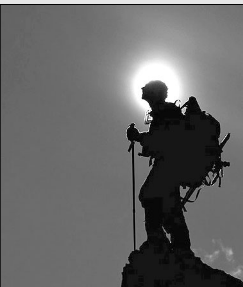
El superhombre tiende a no alcanzar su plenitud.