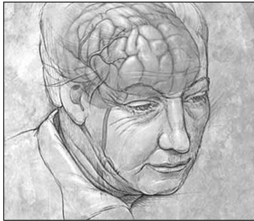
¿Por qué somos como somos? ¿Hacia donde vamos?

oritariamente las mejores soluciones; las estrategias eficaces y sustentables; avaladas por terceros que auten-