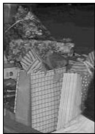
¿Esto es la Navidad?

Haz que los recuerdos de los fallecidos se conviertan en algo agradable. Rememora las cosas positivas de esa persona, recuerda los chistes del abuelo o la tarta tan rica de la abuela.