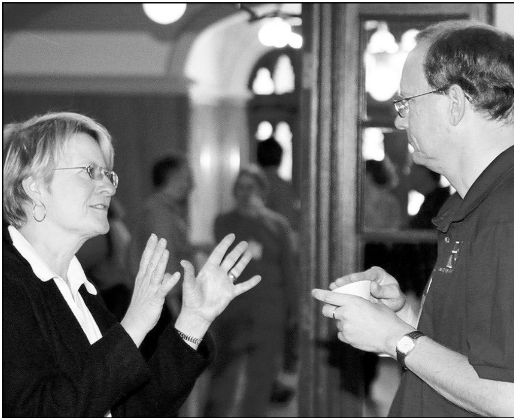
El campo del lenguaje es inherentemente interpretativo, productor de malentendidos.

abras no expresaron plenamente lo que se quiso decir, lo que se pensaba o sentía. De ahí la sensación de que siempre falta algo por vivir, hacer y explicar. La causa está en el origen mismo de la función del lenguaje: como algo que cubre la ausencia de... cosas concretas y tangibles. Por ello la confección de herramientas, tiene como primicia el surgimiento de la primera