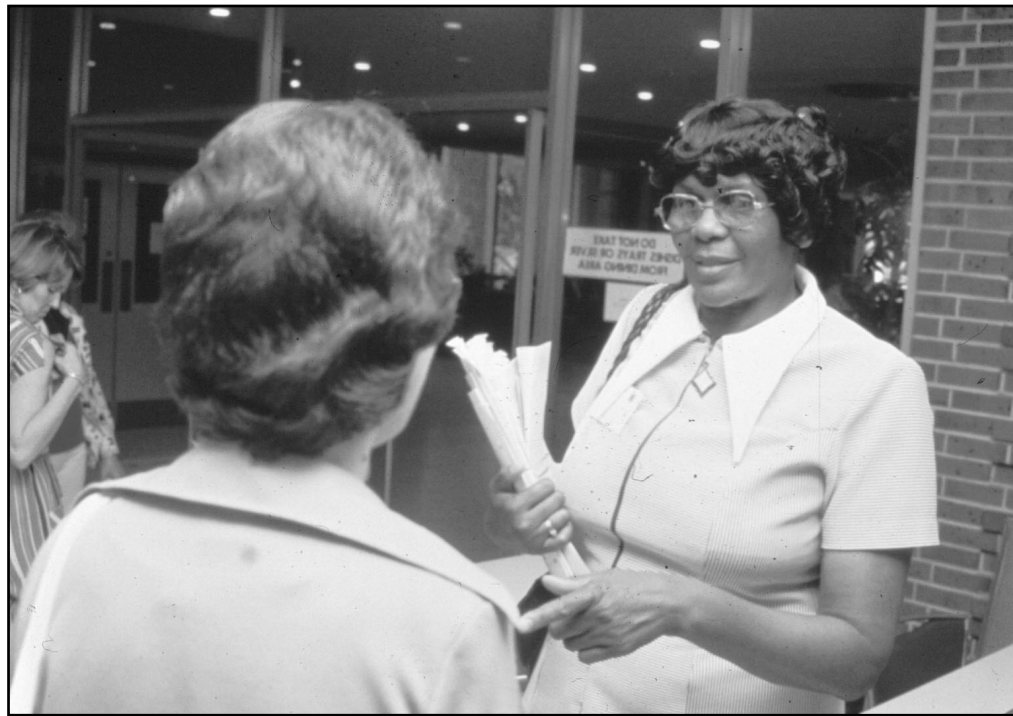
Al hablar, escuchamos, algo es dicho, más allá de lo que la conciencia capta.