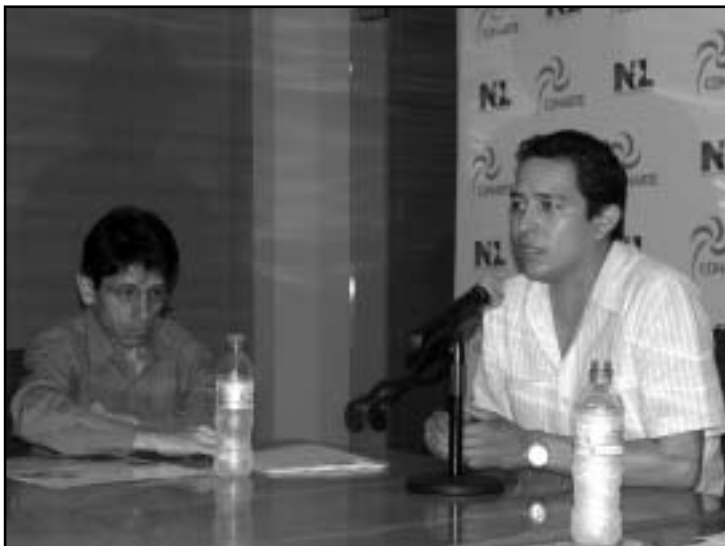
La presentación es hoy, en el Centro de las Artesas.

“Es una muestra de cultura, de paz, hermandad. Este espectáculo - Inkandino-, será presentado solo este día 27, participando los músicos peruanos, que dentro del festival alternan con otros diversos grupos que les sucederán.